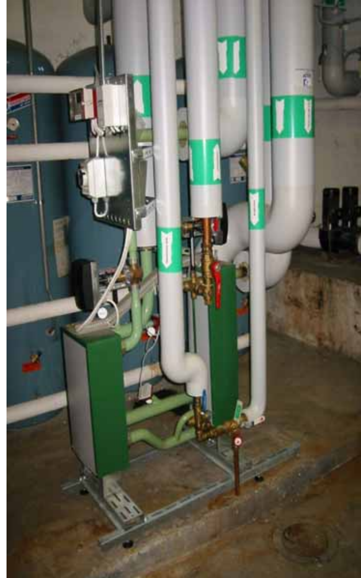
Kundesentral 250 kW+ 170 kW