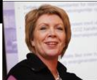
Regjeringens bioenergi strategi