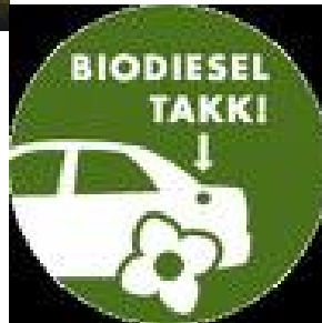
Bio vs food...