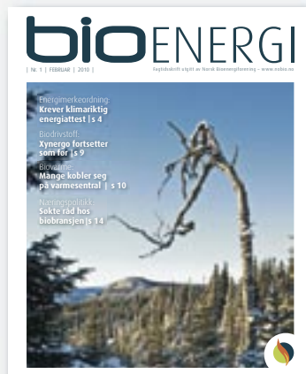
FORSIDEN: Vinterstemning i Norge.

Bioenergi distribueres til NOBIOS medlemmer, energiverkene, kommuner, fylkeskommuner, forskningsinstitusjoner og konsulentfirmaer.